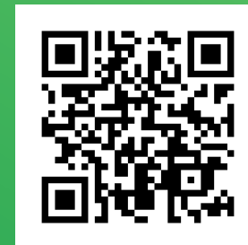
Вконтакте «Инициативное бюджетирование»