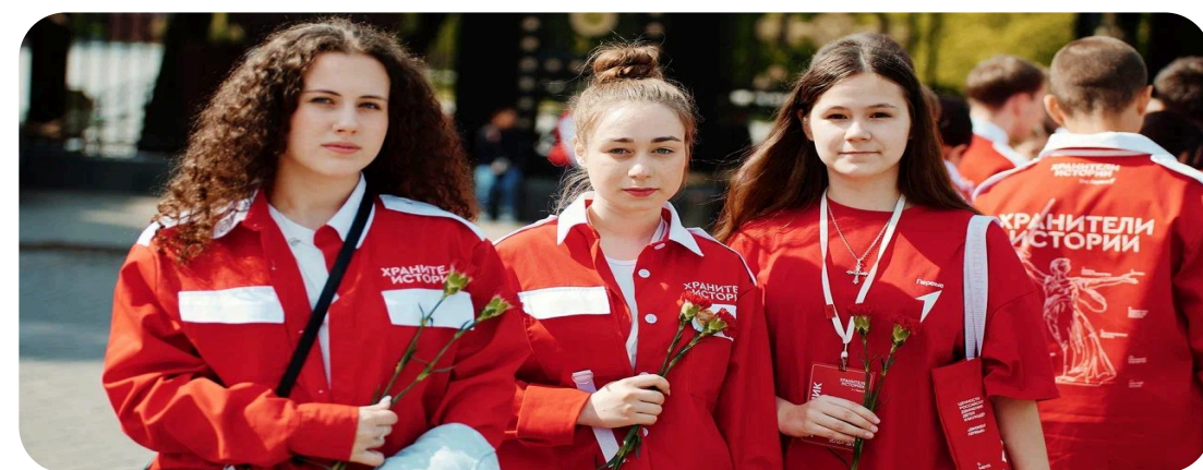
ПАТРИОТИЗМ И ИСТОРИЧЕСКАЯ ПАМЯТЬ