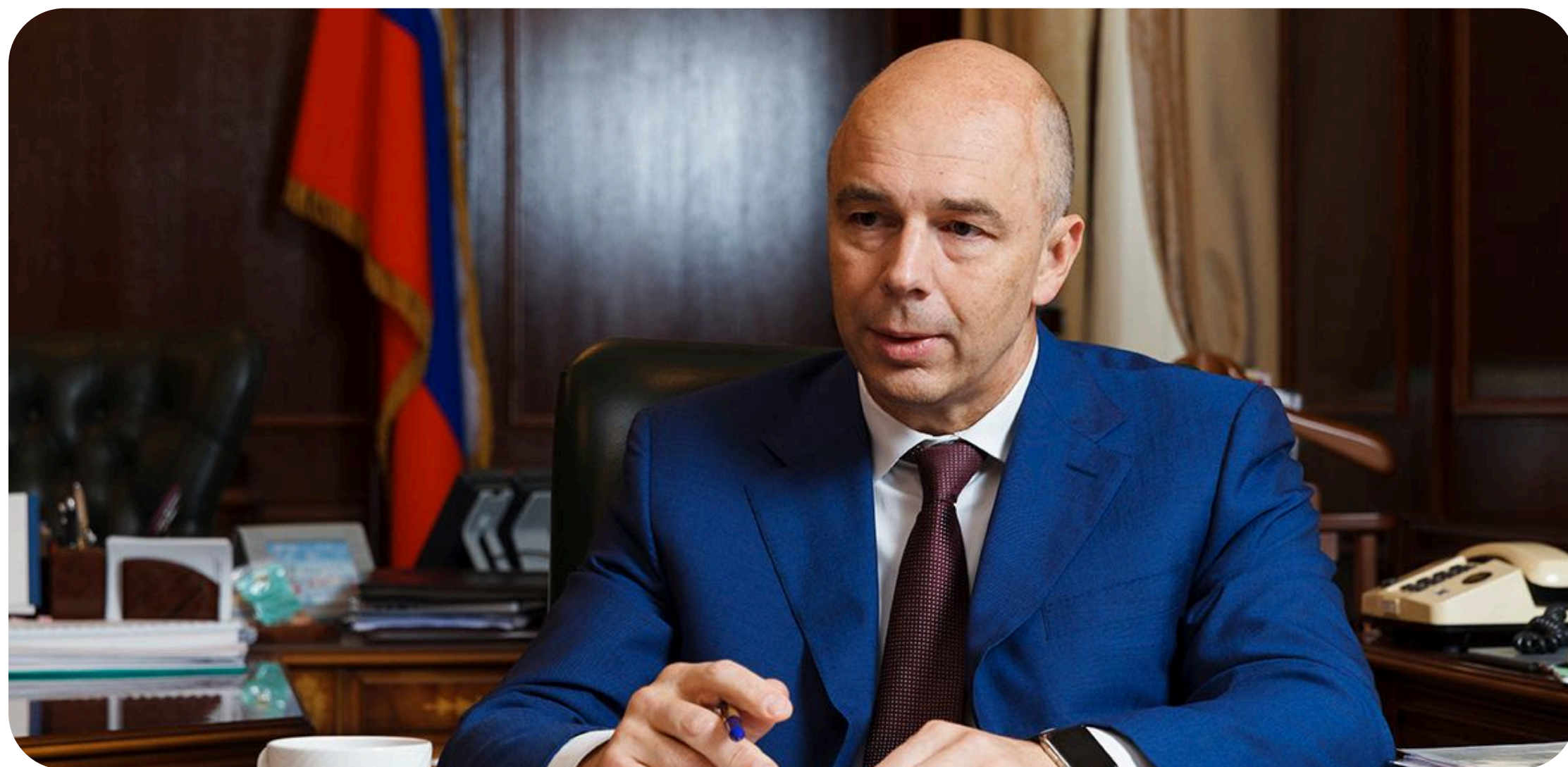
Антон Германович Силуанов - заместитель Председателя Попечительского совета Движения Первых.

С 2023 года и по настоящее время между Движением Первых и Минфином России последовательно развивается активное и системное взаимодействие, направленное на создание новых возможностей для детей и молодёжи, развитие финансовой культуры, профориентацию и гражданскую ответственность.