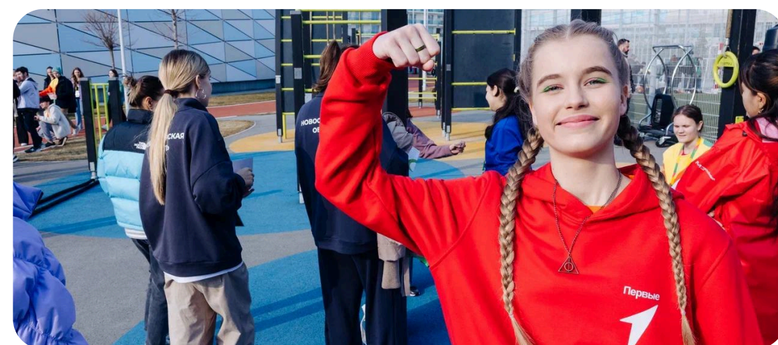
ЗДОРОВЫЙ ОБРАЗ ЖИЗНИ