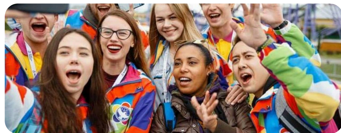
ДИПЛОМАТИЯ И МЕЖДУНАРОДНЫЕ ОТНОШЕНИЯ