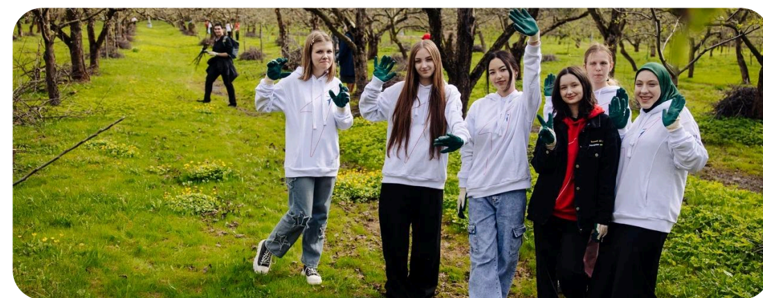
ЭКОЛОГИЯ И ОХРАНА ПРИРОДЫ