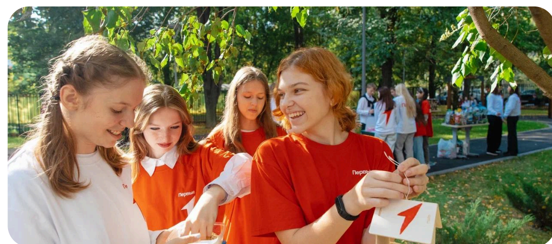
ВОЛОНТЁРСТВО И ДОБРОВОЛЬЧЕСТВО