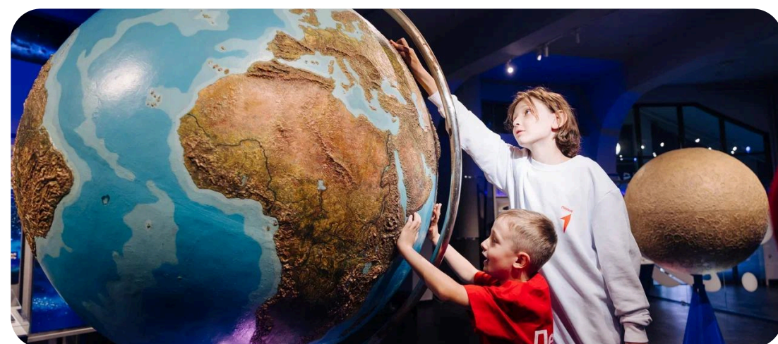
НАУКА И ТЕХНОЛОГИИ