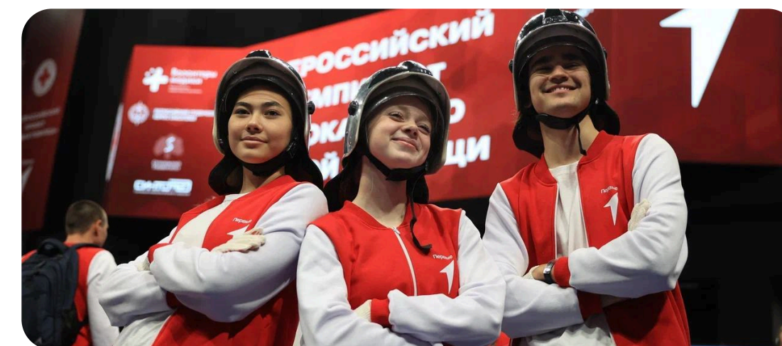
ТРУД, ПРОФЕССИЯ И СВОЁ ДЕЛО