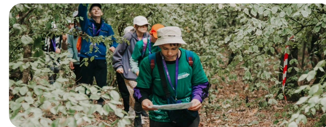
ТУРИЗМ И ПУТЕШЕСТВИЯ