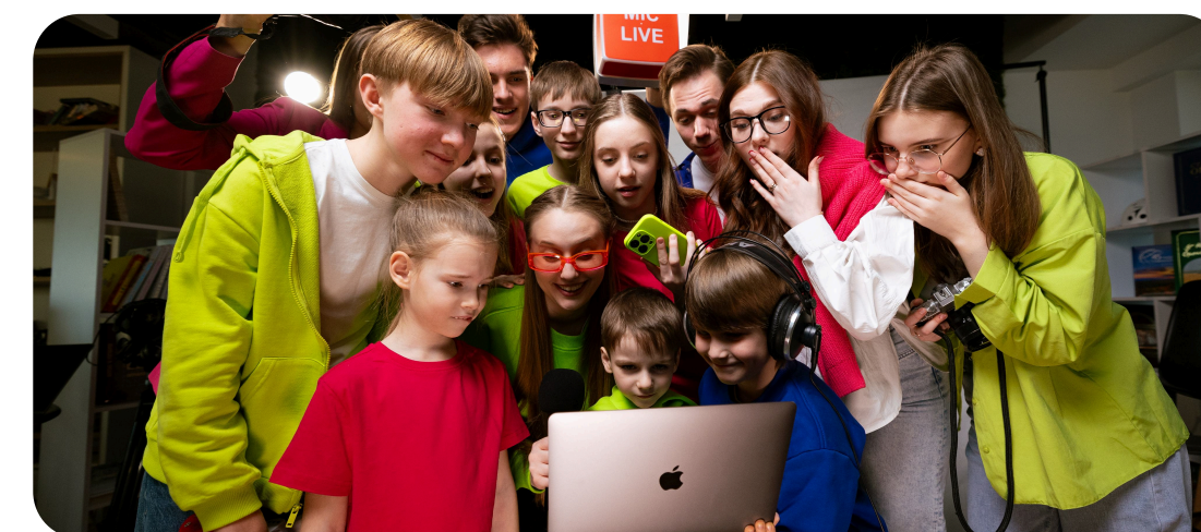
МЕДИА И КОММУНИКАЦИИ