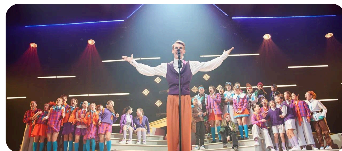
КУЛЬТУРА И ИСКУССТВО